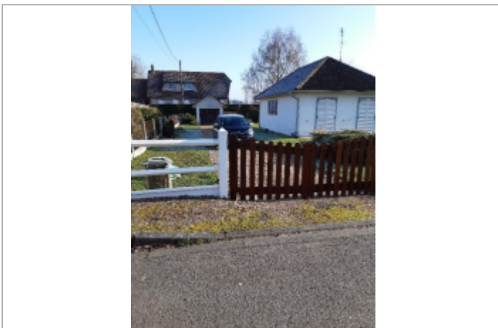
1 rue Claude Monet à Romilly-sur-Andelle

GÉOLOCALISATION Coordonnées WGS84 : X: 1.27009570 / Y: 49.33027500 Coordonnées RGF93 (Lambert 93) X: 574234.67 / Y: 6915900.13 Coordonnées RGF93 (ETRS89) : X: 1.2700957 / Y: 49.330275 Code Hydro: H32-0400 Rive de référence: Droite