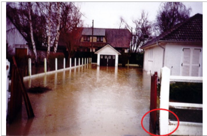
Portail du 1 rue Claude Monet à Romilly-sur-Andelle

MARQUE Maximum de l'inondation : Non renseigné Visibilité : Non État du repère : Disparu Pérennité : Aucune Repère calculé : Non renseigné PHEC : Non renseigné