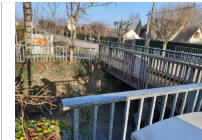
Berge rive droite au 670 avenue de la Gare à Romilly-sur-Andelle