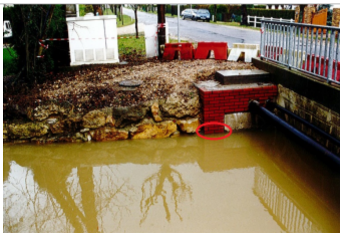
Muret en brique rive droite au 670 avenue de la Gare à Romilly-sur-Andelle

Maximum de l'inondation : Non renseigné Visibilité : Non État du repère : Disparu Pérennité : Moyenne Repère calculé : Non PHEC : Non renseigné