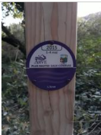
chemin de l'Arve