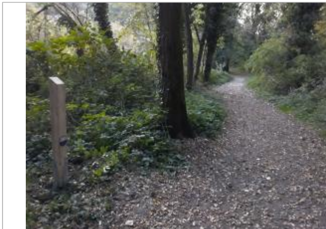
chemin de l'Arve