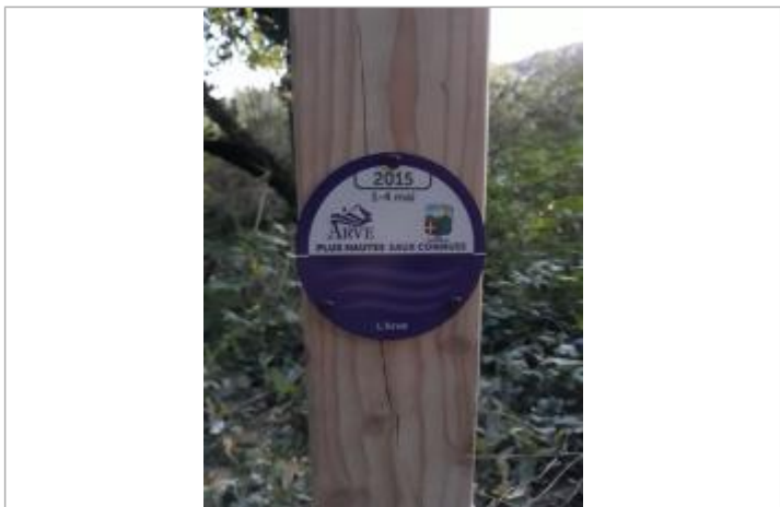
chemin de l'Arve

MARQUE Texte : crue de l'Arve du 1 au 4 mai 2015 Maximum de l'inondation : Oui Visibilité : Oui État du repère : Bon Pérennité : Longue