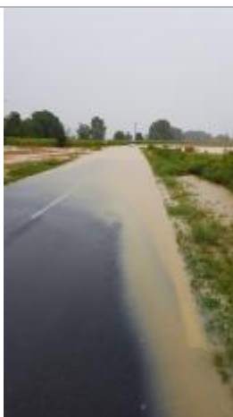
Inondation de la route en allant vers Caujac - débordement de la Mouillonne et ruissellements de coteaux