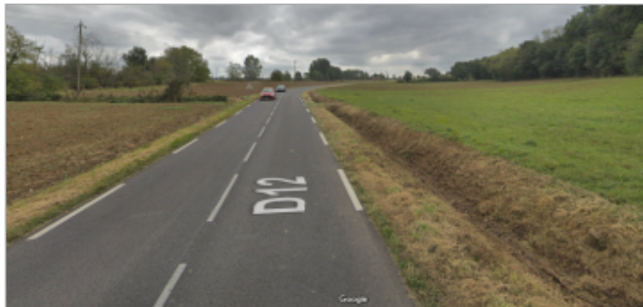
Vue de la RD12 en direction de Caujac - octobre 2018 après les orages de juillet