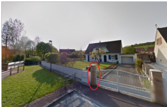
Pilier en brique à gauche du portail du 29 résidence les prairies à Martin-Eglise.

Coordonnées WGS84 : X: 1.13186020 / Y: 49.90009700