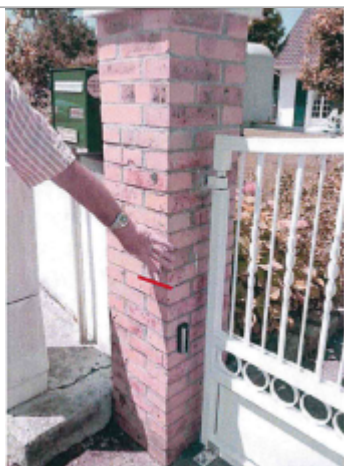
Marque à la 12ème brique en partant du sol sur le pilier à gauche du portail du 29 résidence les prairies à Martin-Eglise.

Altitude calculée de l'eau (en m) : 5.32 m