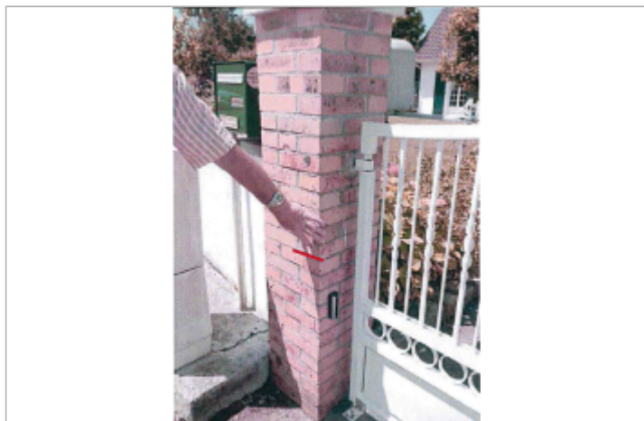
Marque à la 12ème brique en partant du sol sur le pilier à gauche du portail du 29 résidence les prairies à Martin-Eglise.

Altitude calculée de l'eau (en m) : 5.32 m