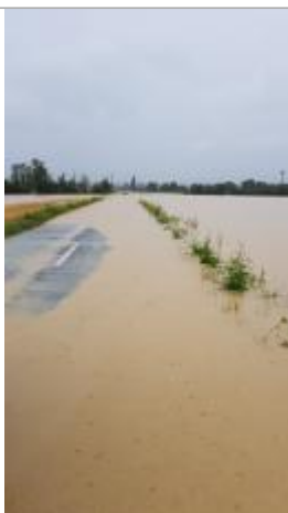
Vue vers Auterive, à droite on distingue le lieu dit "Pourciel"