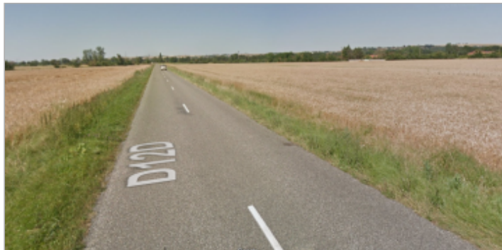
Vue de la RD12D vers Auterive - juin 2018 avant la crue