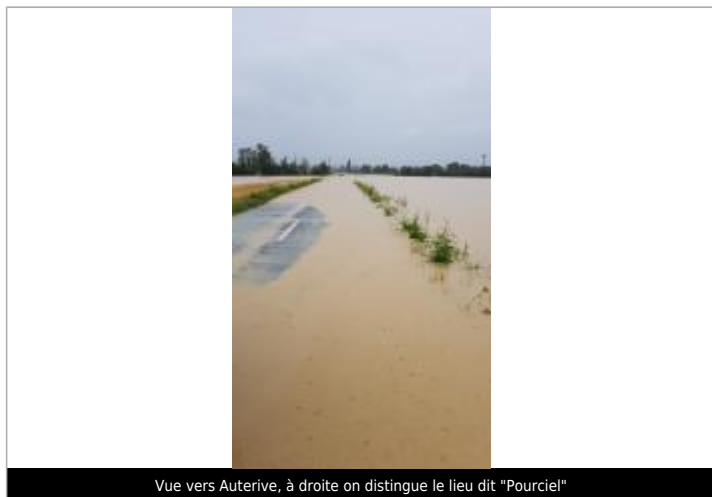
Vue vers Auterive, à droite on distingue le lieu dit "Pourciel"