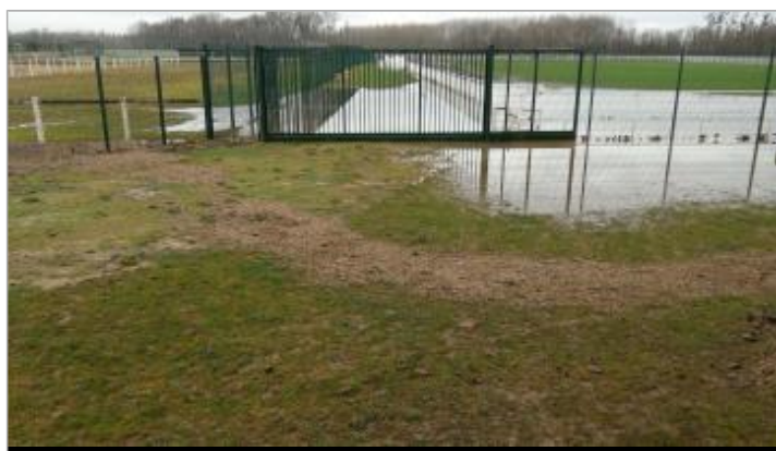
Photo de la marque

Méthode : GPS Référence nivelée : Marque d'inondation Système altimétrique : NGF IGN 1969 (système normal) Altitude de la référence (en m) : 82.620 m Altitude calculée de l'eau (en m) : 82.62