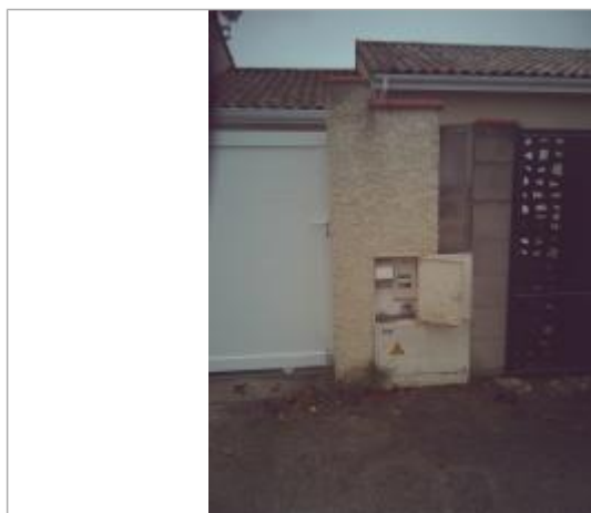
Laisse de crue dans le boîtier électrique - n°25 rue du stade