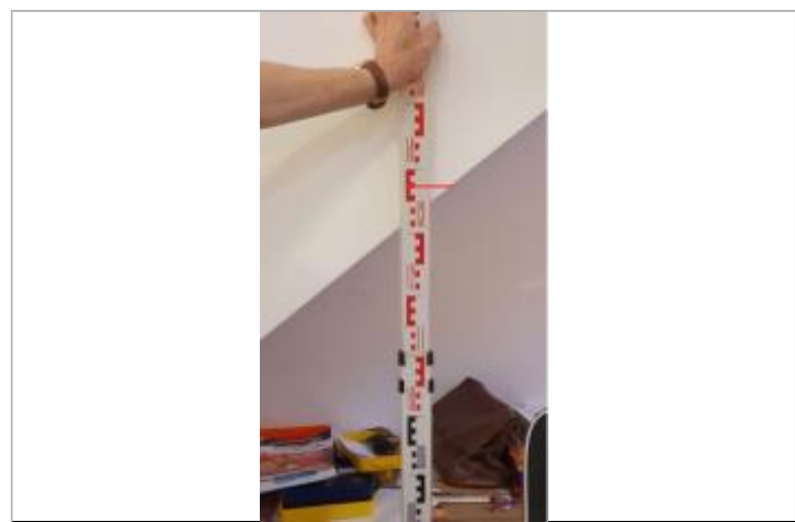
Hauteur de crue du 06/11/15

GÉNÉRAL Code : WEB_R_202001215248 Date de mise à jour : 28/04/2021 Auteur : gestionnaire_SCVigicruces