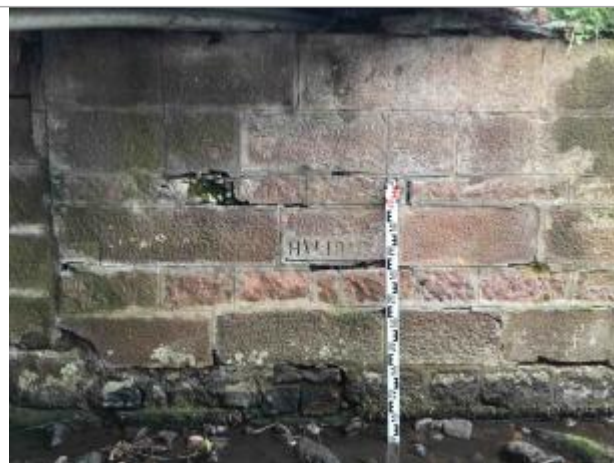
Culée latérale du pont RD426 avec indicateur TN +0.83, selon mire