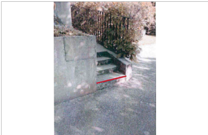
Au 7 grande rue de Salines, sur le côté de la maison situé au nord-ouest, au niveau de la première marche en partant du sol d'un escalier en béton.

GÉNÉRAL Code : WEB_R_202001214018 Date de mise à jour : 02/12/2025 Auteur : CONTRIB_01