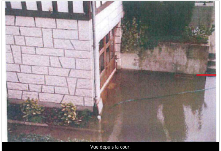
Vue depuis la cour.

Coordonnées WGS84 : X: 1.11135800 / Y: 49.90716700