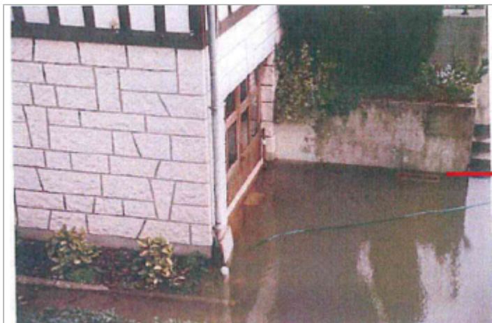
Vue depuis la cour.