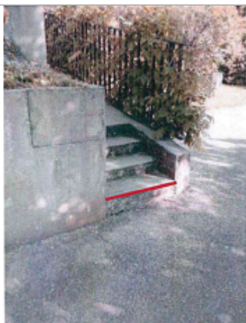
Au 7 grande rue de Salines, sur le côté de la maison situé au nord-ouest, au niveau de la première marche en partant du sol d'un escalier en béton.

Altitude calculée de l'eau (en m) : 4.99