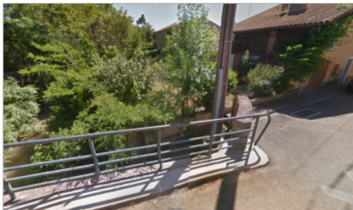
Pont sur le Calers -Vue du site avant la crue de juillet - juin 2018