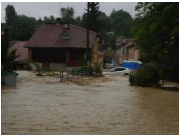
Pont submergé vers le max de crue