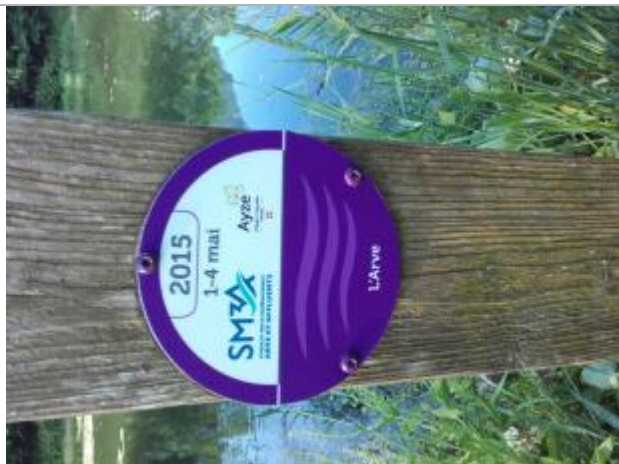
crue de l'Arve du 1er mai 2015