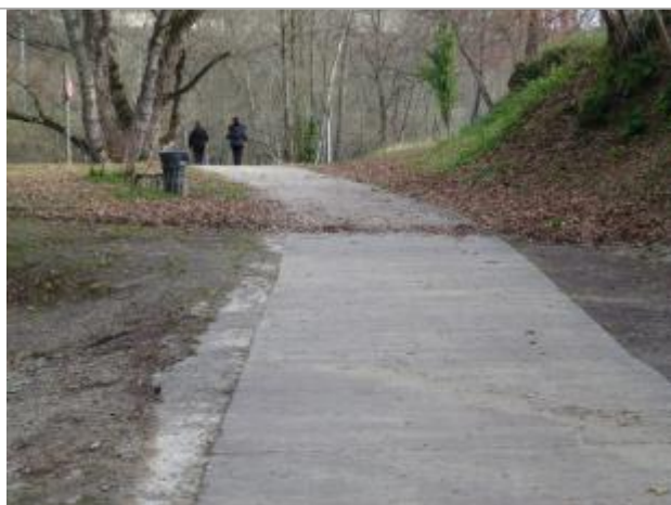
Laisse de crue sur le chemin