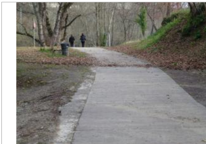
Vue du chemin piéton en pente et des laisses de la crue du 13 décembre 2019

Coordonnées RGF93 (ETRS89) : X: 1.6203349 / Y: 42.956749