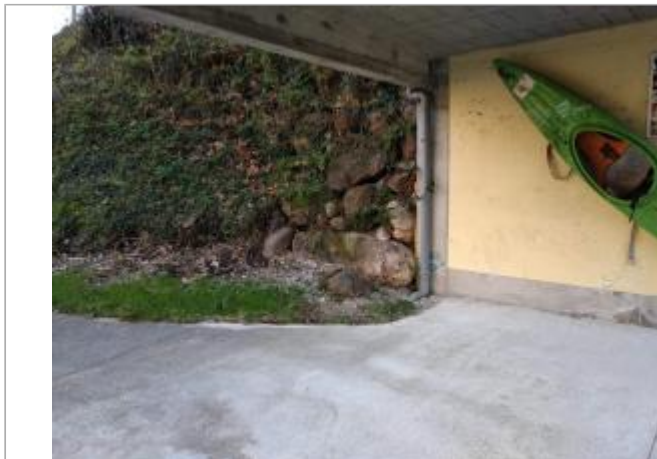
Mémorial sous le club FCKEV