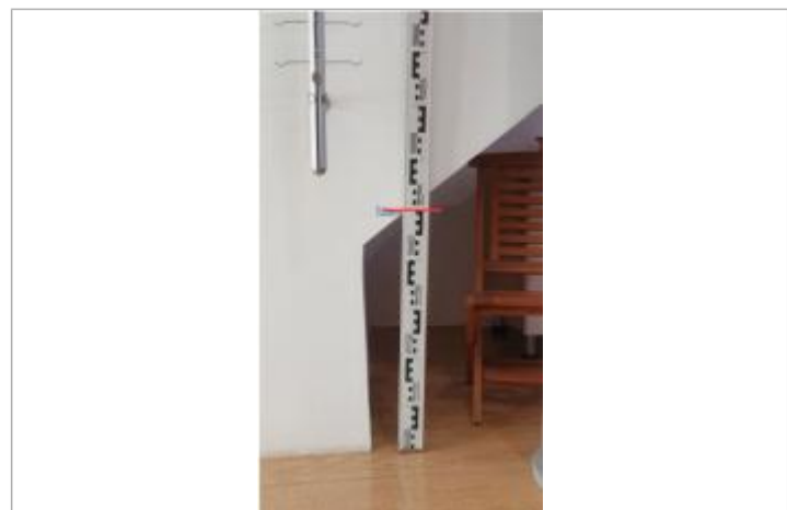
Hauteur de la crue du 31/10/19

GÉNÉRAL Code : WEB_R_202001151946 Date de mise à jour : Auteur : CVH_Martinique 28/04/2021