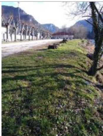
Laisses de crue le long du parking (vue vers l'amont)

Altitude calculée de l'eau (en m) : 467.94 m