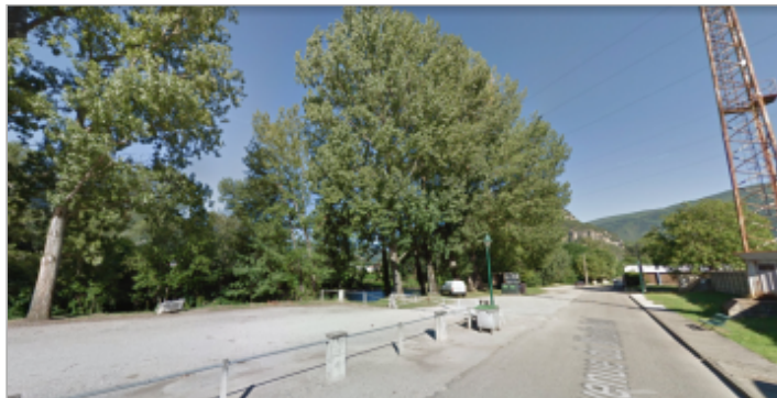
Vue du site en 2013