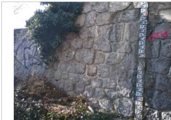
Vue de l'échelle et marque de la crue du 13 décembre 2019