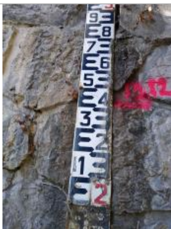
Zoom sur la marque à l'échelle - 13/12/19

Altitude calculée de l'eau (en m) : 474.05