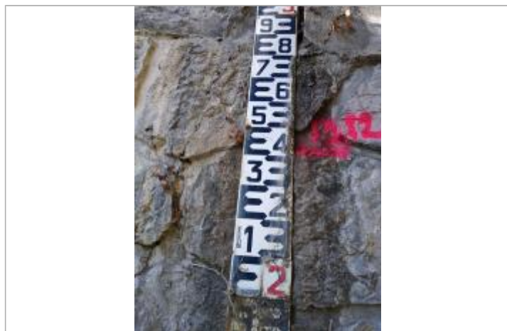
Zoom sur la marque à l'échelle - 13/12/19