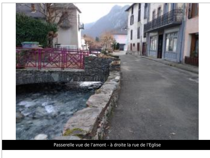
Passerelle vue de l'amont - à droite la rue de l'Eglise