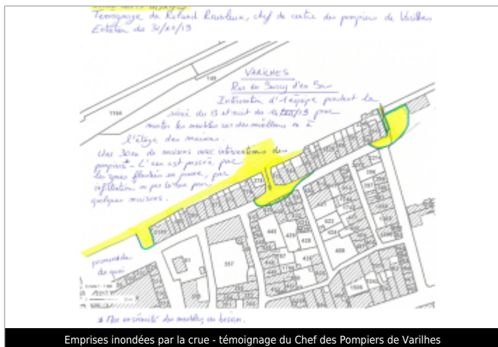
Emprises inondées par la crue - témoignage du Chef des Pompiers de Varilhes