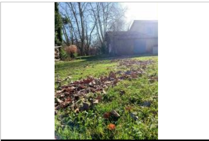
Laisse de crue du 14 décembre 2019 - ferme de Brassacou

GÉOLOCALISATION Coordonnées WGS84 : X: 1.61495959 / Y: 43.09524640 Coordonnées RGF93 (Lambert 93) X: 587153.11 / Y: 6222763.63 Coordonnées RGF93 (ETRS89) : X: 1.6149596 / Y: 43.0952464 Code Hydro: 01--0250 Rive de référence: