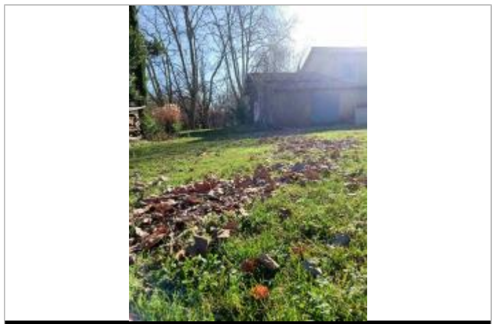
Laisse de crue devant le bâtiment principal

MARQUE Maximum de l'inondation : Oui Visibilité : Non