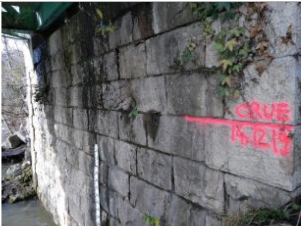
Hauteur atteinte le 14/12/2019 - environ 3m70 à l'échelle

Altitude calculée de l'eau (en m) : 271.84 m