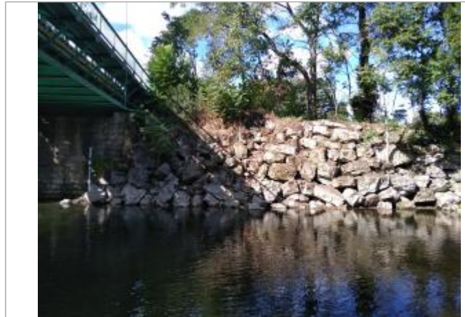
Vue depuis l'atterrissement central - à gauche sous le pont l'échelle