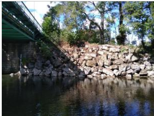
Vue depuis l'atterrissement central - à gauche sous le pont l'échelle