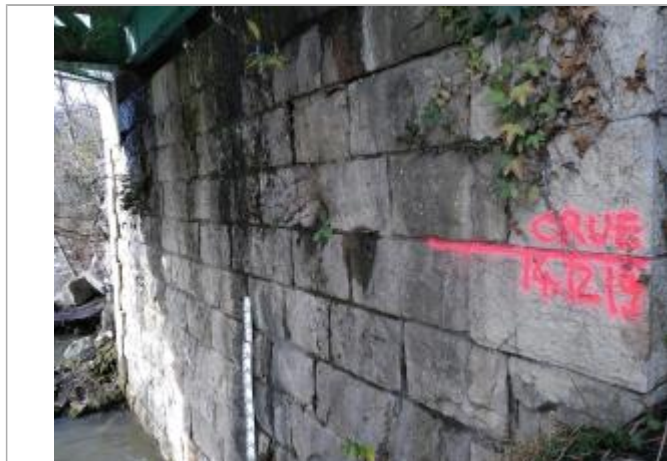
Hauteur atteinte le 14/12/2019 - environ 3m70 à l'échelle