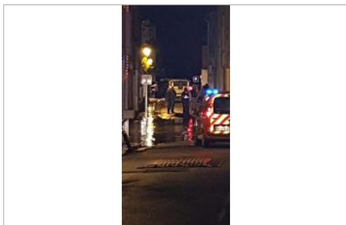
Intervention des sapeurs pompiers pour mettre en sécurité les biens

Maximum de l'inondation : Non renseigné Visibilité : Oui