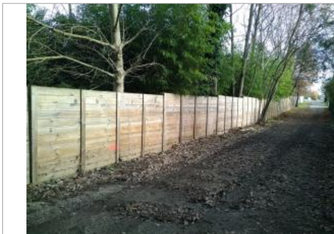
Palissade de clôture à l'amont immédiat de la confluence - traces de la crue du 14/12/2019