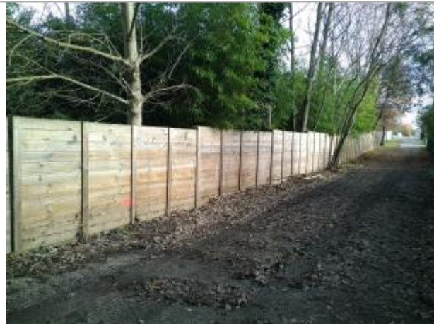
Palissade de clôture à l'amont immédiat de la confluence - traces de la crue du 14/12/2019