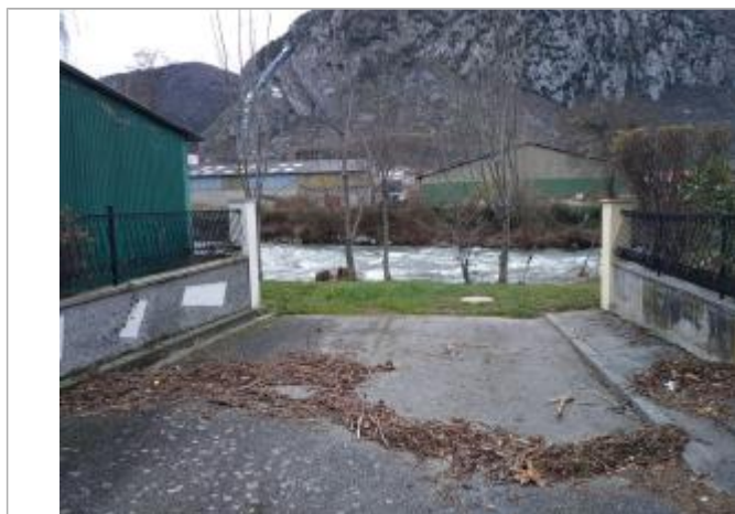
Hauteur atteinte au niveau du n°3 de la rue Salvador Allende