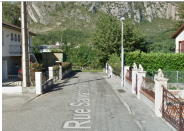
Vue de l'impasse accédant au Vicdessos - août 2013