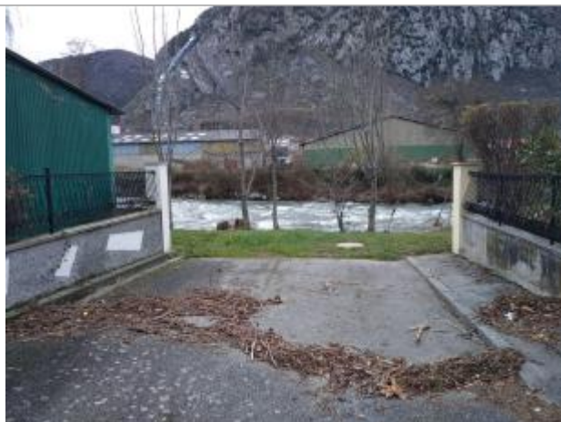
Hauteur atteinte au niveau du n°3 de la rue Salvador Allende

Altitude calculée de l'eau (en m) : 477.55