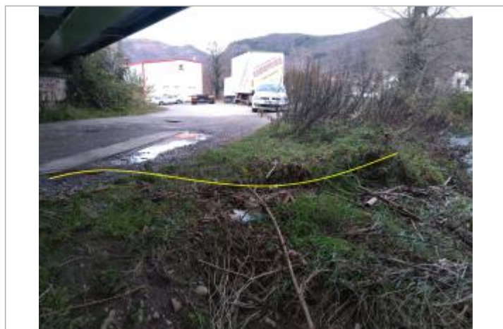
Hauteur atteinte au niveau de la rue - limite débordant