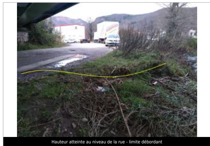
Hauteur atteinte au niveau de la rue - limite débordant