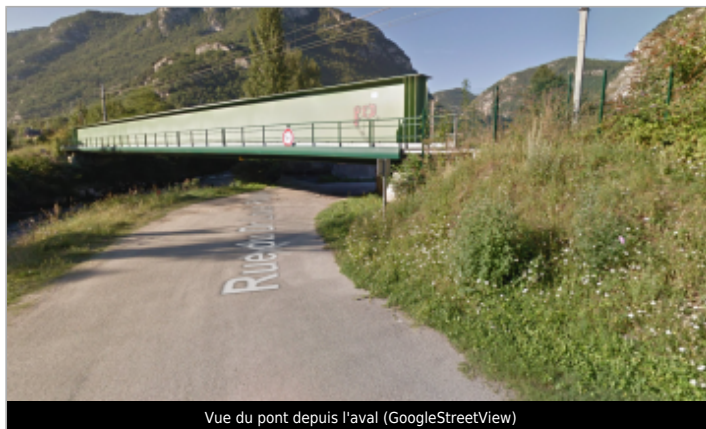
Vue du pont depuis l'aval (GoogleStreetView)