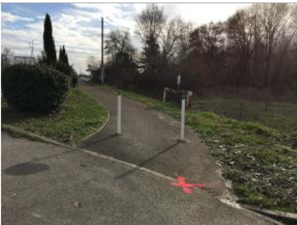
La laisse a été matérialisée par la croix orange