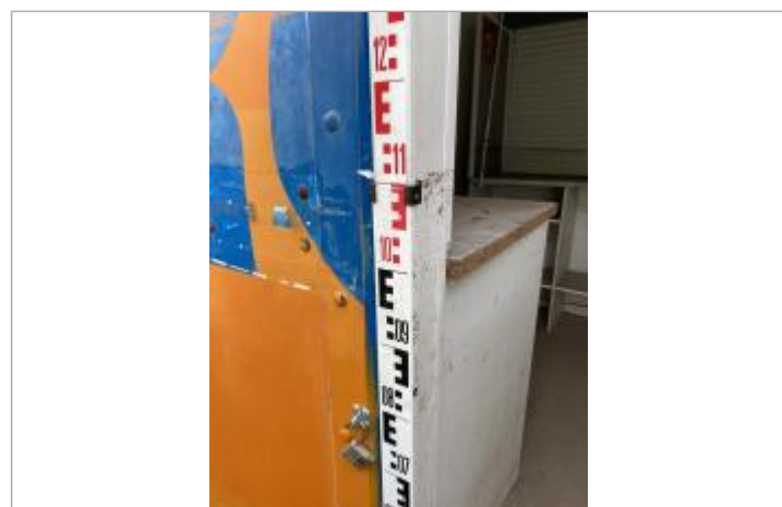
Vue de la prise de mesure

MARQUE Maximum de l'inondation : Oui Visibilité : Oui État du repère : Bon Pérennité : Aucune