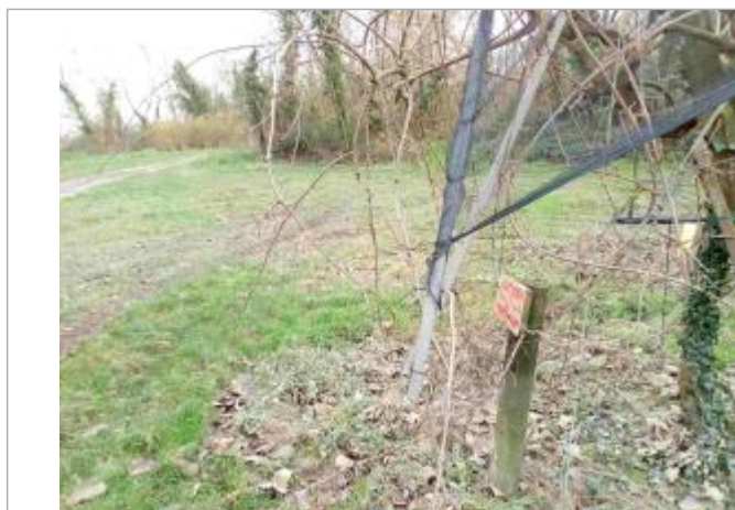
Vue du poteau

SOURCE DE REPÉRAGE : RELEVÉ POST-CRUE DU 15-16 DÉCEMBRE 2019 SUR LA GARONNE AGENAISE SPC GTL (820470) - 19/12/2019