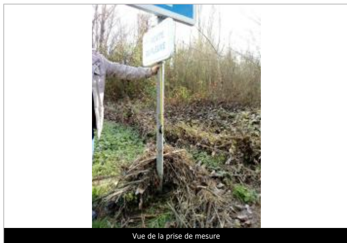
Vue de la prise de mesure

Texte : 12.19 Maximum de l'inondation : Oui Visibilité : Oui État du repère : Bon Pérennité : Moyenne