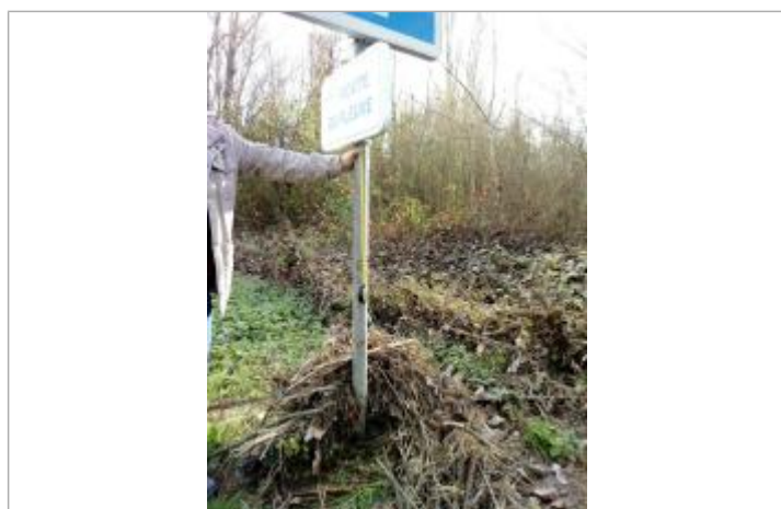
Vue de la prise de mesure

Code : WEB_R_202001100441 Date de mise à jour : 11/03/2020 Auteur : SPC GTL