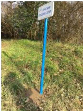
Vue du panneau

Commentaires sur le nivellement : + 40 cm au dessus du sol