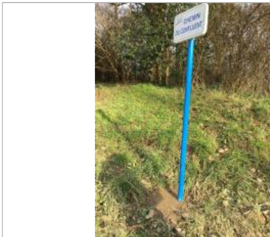
Vue du panneau

Commentaires sur le nivellement : + 40 cm au dessus du sol