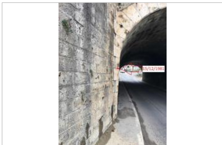
Marque de la crue de décembre 1981

SOURCE DE REPÉRAGE : RELEVÉ POST-CRUE DU 15-16 DÉCEMBRE 2019 SUR LA GARONNE AGENAISE SPC GTL (820470) - 19/12/2019