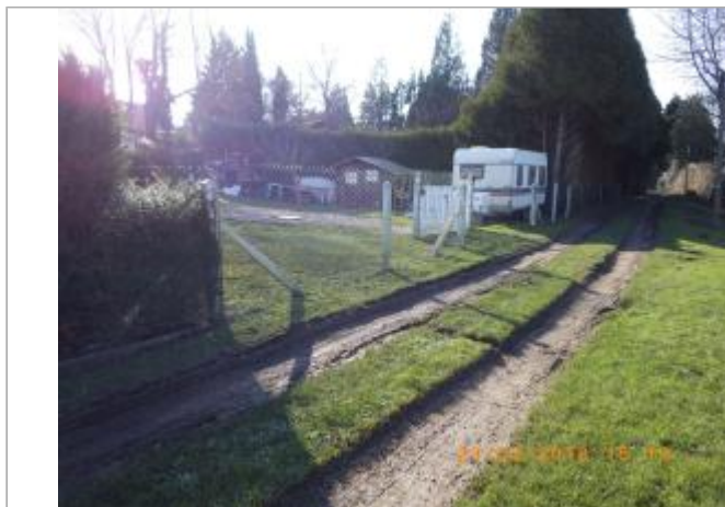
vue du portail d'un des jardins concernés