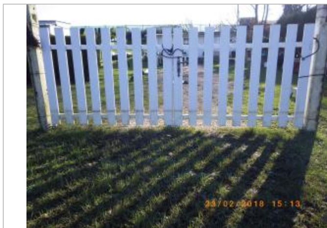
vue de la laisse visible sur le portail d'entrée du jardin

NIVELLEMENT EFFECTUÉ PAR LE SPC SACN. LE SPC N'EST PAS GÉOMÈTRE EXPERT, LES COTES SONT DONNÉES À TITRE INDICATIF. - 23/02/2018