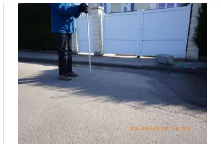
vue du niveau atteint par l'eau

MARQUE Maximum de l'inondation : Oui Visibilité : Non État du repère : Disparu Pérennité : Aucune