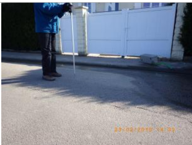
vue du niveau atteint par l'eau

Altitude calculée de l'eau (en m) : 6.59