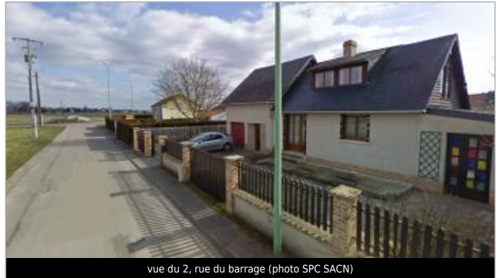
vue du 2, rue du barrage

Coordonnées WGS84 : X: 1.06355850 / Y: 49.29899400