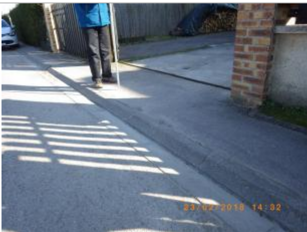
vue du niveau atteint par l'eau

Altitude calculée de l'eau (en m) : 6.75 m