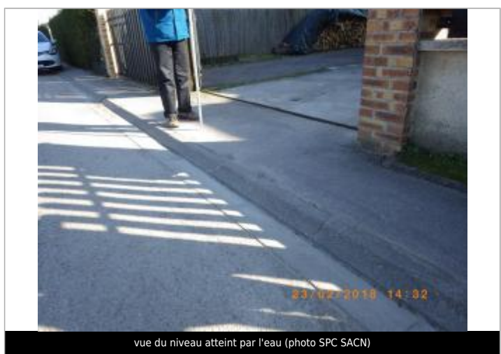
vue du niveau atteint par l'eau

MARQUE Maximum de l'inondation : Oui Visibilité : Non État du repère : Disparu Pérennité : Aucune