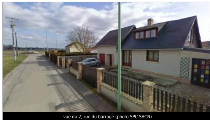
vue du 2, rue du barrage

GÉOLOCALISATION Coordonnées WGS84 : X: 1.06355850 / Y: 49.29899400 Coordonnées RGF93 (Lambert 93) X: 559136.78 / Y: 6912769.93 Coordonnées RGF93 (ETRS89) : X: 1.0635585 / Y: 49.298994 Code Hydro: ----0010 Rive de référence: Gauche