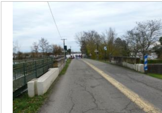
Photo prise à un niveau proche du maximum de la crue

Type de repérage : Campagne de terrain post-inondation