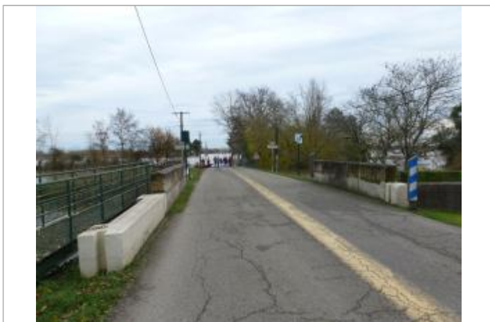
Photo prise à un niveau proche du maximum de la crue

Maximum de l'inondation : Oui État du repère : Disparu