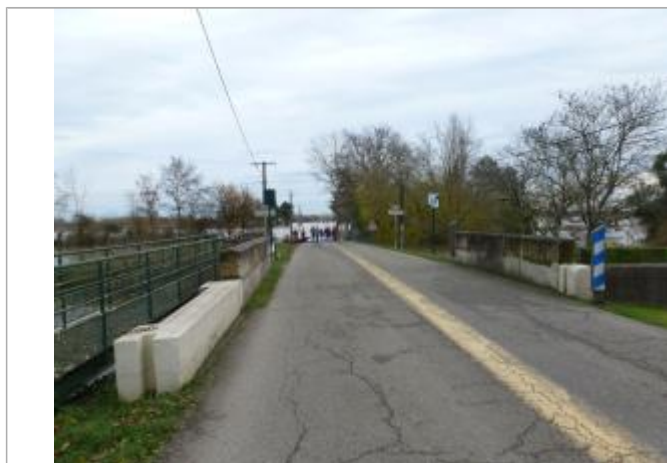
Photo prise à un niveau proche du maximum de la crue

SOURCE DE REPÉRAGE : RELEVÉ POST-CRUE DU 16 DÉCEMBRE 2019 SUR LA GARONNE MARMANDAISE SPC GTL - 06/01/2020