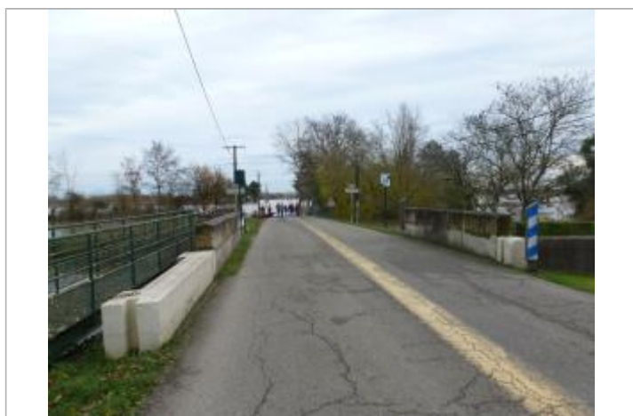
Photo prise à un niveau proche du maximum de la crue

Maximum de l'inondation : Oui État du repère : Disparu