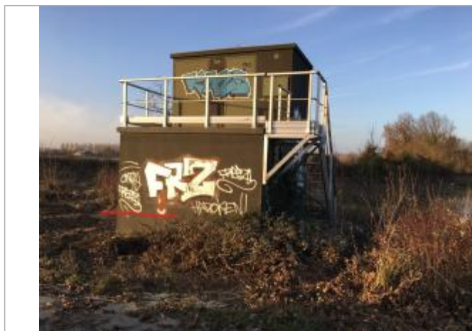
La crue est arrivée 2.00 m en dessous de la terrasse du transformateur

Type de repérage : Campagne de terrain post-inondation