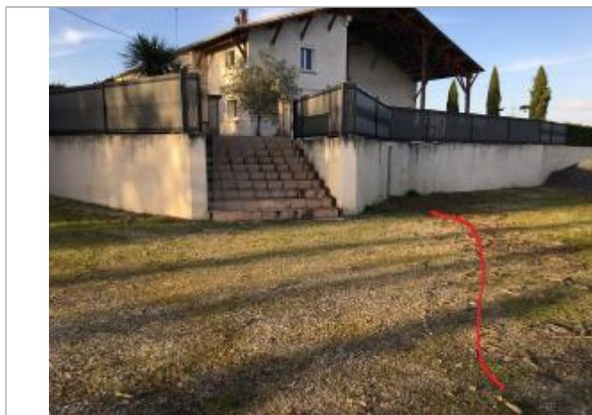
Vue de la marque laissée par la crue et confirmée par le propriétaire de la villa

Type de repérage : Campagne de terrain post-inondation