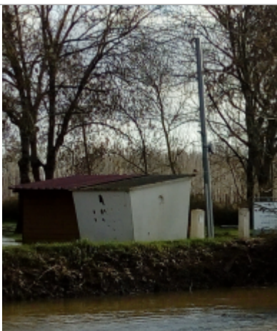
Marque de laisse de crue sur le poteau électrique

Altitude calculée de l'eau (en m) : 22.292