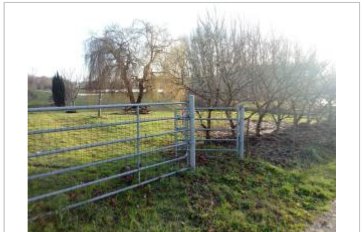
Terrain à Lugat au bord du Trec