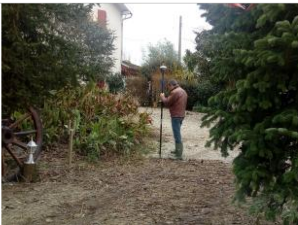
Vu de la laisse de crue

Altitude calculée de l'eau (en m) : 23.775 m