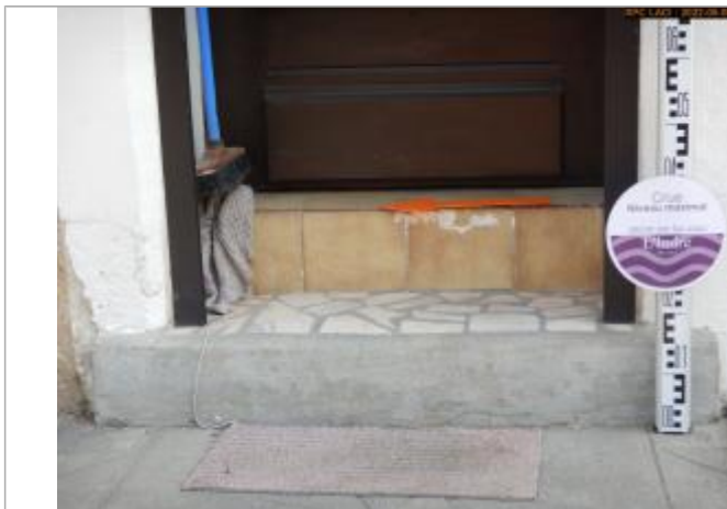
entrée du parking du restaurant

NIVELLEMENT EFFECTUÉ PAR LE SPC SACN. LE SPC N'EST PAS GÉOMÈTRE EXPERT, LES COTES SONT DONNÉES À TITRE INDICATIF. - 23/03/2018