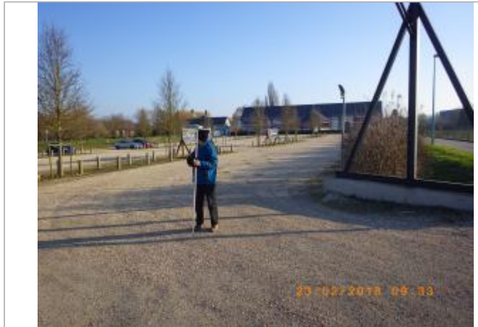
entrée du parking du restaurant

Coordonnées WGS84 : X: 1.09154200 / Y: 49.33193000